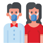
Equipo de Protección Personal